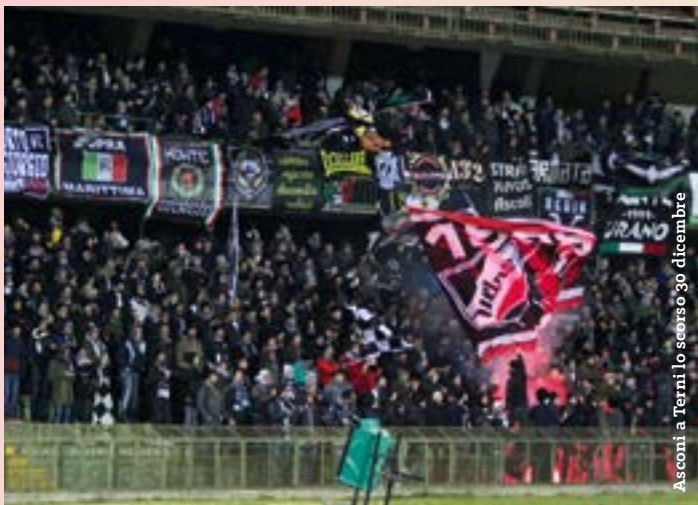
Ascoli a Terni lo scorso 30 dicembre