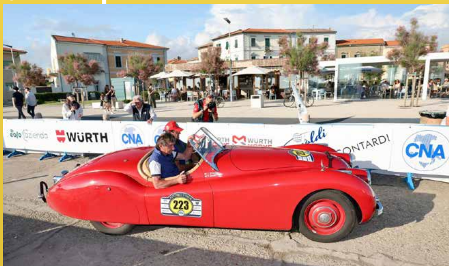
Jaguar XK120 del 1957