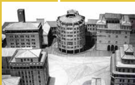
L'uovo di Ridolfi