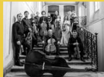
I solisti di Pavia

L'Orchestra da Camera I Solisti di Pavia è stata fondata nel 2001 dall'incontro tra la Fondazione Banca del Monte di Lombardia e il violoncellista Enrico Dindo. Nel corso dell'attività ha avuto l'onore di accogliere come Presidente Onorario il violoncellista russo Mstislav Rostropovich, oltre a realizzare tournée internazionali di successo in Russia, Sud America, Repubbliche Baltiche, Libano, Algeria, Malta, Svizzera, e ospiti di sale prestigiose come il Teatro dell'Ermitage di San Pietroburgo, la Sala Tchaikovsky di Mosca, la Salle Paderewski a Losanna, il Teatro Coliseo a Buenos Aires, la Salle Gaveau a Parigi ed il Teatro alla Scala di Milano.