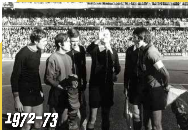
12/11/1972, Ternana-Cagliari 1-1