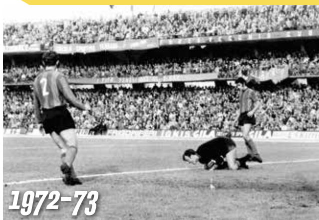
29/10/1972, Ternana-Bologna 2-0